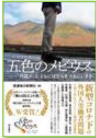
『五色のメビウス』 信濃毎日新聞社 366.89/IT