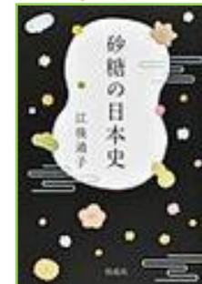
『砂糖の日本史』 江後迪子 383.81/EG