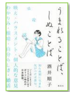
『うまれることば、しぬことば』 酒井順子 914.6/SA