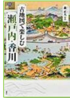
『古地図で楽しむ瀬戸内・香川』 森正人 291.82/MO