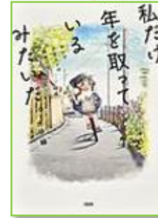
『私だけ年を取っているみたいだ。』 水谷緑 369/MI