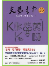
『文藝もず』 菊池寛記念館 郷土関連コーナー