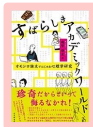
『すばらしきアカデミックワールド』 越智 啓太 140.4/OC