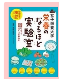
『女子栄養大学 栄養のなるほど実験室』 吉田企世子 498.55/JY