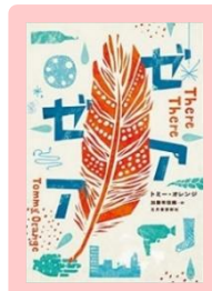
『ゼア ゼア』 トミー・オレンジ 933.7/OR