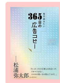
『毎日読みたい365日の広告コピー』 WRITES PUBLISHING 674/WR