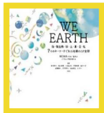
『WE EARTH～海・微生物・緑・土・星・空・虹7つのキーワードで知る地球のこと全部～』 NOMA 450/WE

空にまつわる言葉を集めた辞典。綿雲・暁・にわか雨など生活に密着した言葉から、ブルーアワー・木の芽雨などあまり馴染みのない言葉まで収録。まるで写真集を見ているかのような美しい画像と解説の言葉は、空から届けられたメッセージのように読者に届けられる。もはや辞典だけではない辞典。