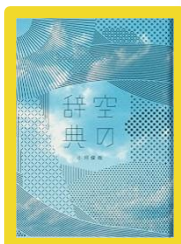
『空の辞典』 小河 俊哉 748/0G

http://lib.kjc.ac.jp/csp/carinhp/CARhpTOP.csp