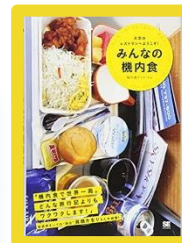
『天空のレストランへようこそ! みんなの機内食』 機内食ドットコム 687.5/K1

空の上でのおもてなし。機内食はまさに特別なレストランです。ファーストクラスの“極上の一品”から各社の個性あふれるワンプレートまで。天空で食べるごちそう図鑑!!