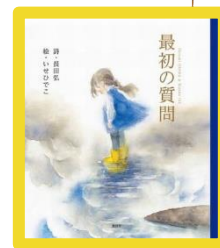
『最初の質問』 絵 いせ ひでこ 誌 長田 弘 726.6/OS

ANA 機内誌連載をまとめたエッセイ集。25篇からなり、旅先の人や場所との出会い、匂い、音、手触りが感じられ、旅に行っているような気分。なかなか旅に出かけることができないこのご時世、読む旅を楽しんでみてはどうですか?