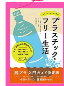
「プラスチックフリー生活 今すぐできる小さな革命」 シャンタル・プラモンドン 他 519/PL

その「症状」は日用品のせい? 空気中にまで広がっているプラスチックによる様々な健康被害。