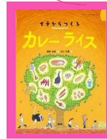
「イチからつくるカレーライス」 関野吉晴 596.3/SE