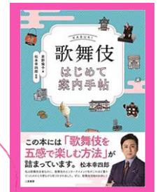
「歌舞伎はじめて案内手帖」 君野倫子 774/KI

歌舞伎は行く前から始まっている! 歌舞伎の基本知識からグルメ、ファッション等々。歌舞伎を五感で楽しむならこれ!