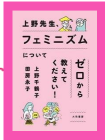
「上野先生、フェミニズムについてゼロから教えてください!」 上野千鶴子 他 367.1/UE

女であることは大変? 東京大学名誉教授 上野千鶴子先生に対談形式でゼロから学ぶフェミニズム。