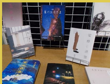
デザイン・アートコース 2年生による作品