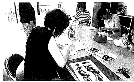
世界にたった1冊の絵本づくりに挑戦するお母さんたち。わが子との絆が一段深まる「読み聞かせと手づくり絵本づくり講座」。