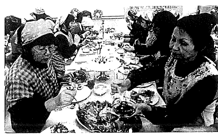
毎年、多くの主婦の皆さんの受講で盛況の「クリスマス料理教室」。手づくりの豪華料理に笑顔も弾けます。