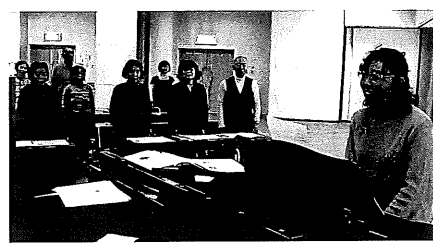
唱歌や懐メロに挑戦する「日本の歌を楽しもう」。青春時代を思い出しての歌は、生きる喜びを与えてくれます。