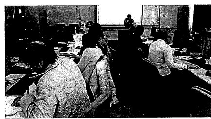
根強い人気の「パソコン教室」。エクセルやワードの使用法をマスターすれば、新たな世界が広がります。

未知の世界への挑戦者 社会人といっても年齢層は幅広く20歳代から60歳代まで。子育て真っただ中の者、全く異なる他業種から者、可能な限り現役で働き続けたい社会の役に立ちたい定年後の者など、どの学生もさらなる可能性を切り開く、未知の世界への挑戦者です。 新卒生の頼れる存在 社会人学生については、学習意欲の高さなど多くの