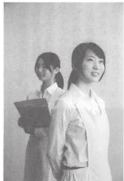
医療事務ユニット