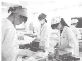
フードコーディネーターユニット